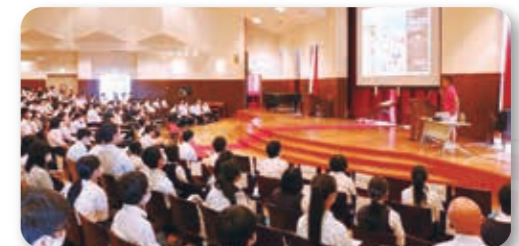
▲ 滋賀県高文連写真部会「夏季撮影会」2021年7月26日

併催: 私たちの浅小井キャンパス ~心のPhoto Memories~ 小学生児童による写真展(5月中旬頃まで)