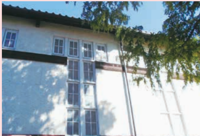
桃井氏による小学校写真教室・6年生の作品